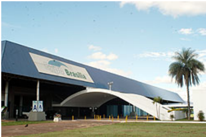
Entrada do Pavilhão de Exposições

O objetivo é criar um espaço nacional de debates, no coração do Brasil (Brasília), sobre o desenvolvimento, com base na produção aplicada do Ipea, mas fazê-lo de forma aberta a estudantes, profissionais, agentes públicos, estudiosos, pesquisadores, especialistas, professores, legisladores, entre outros.