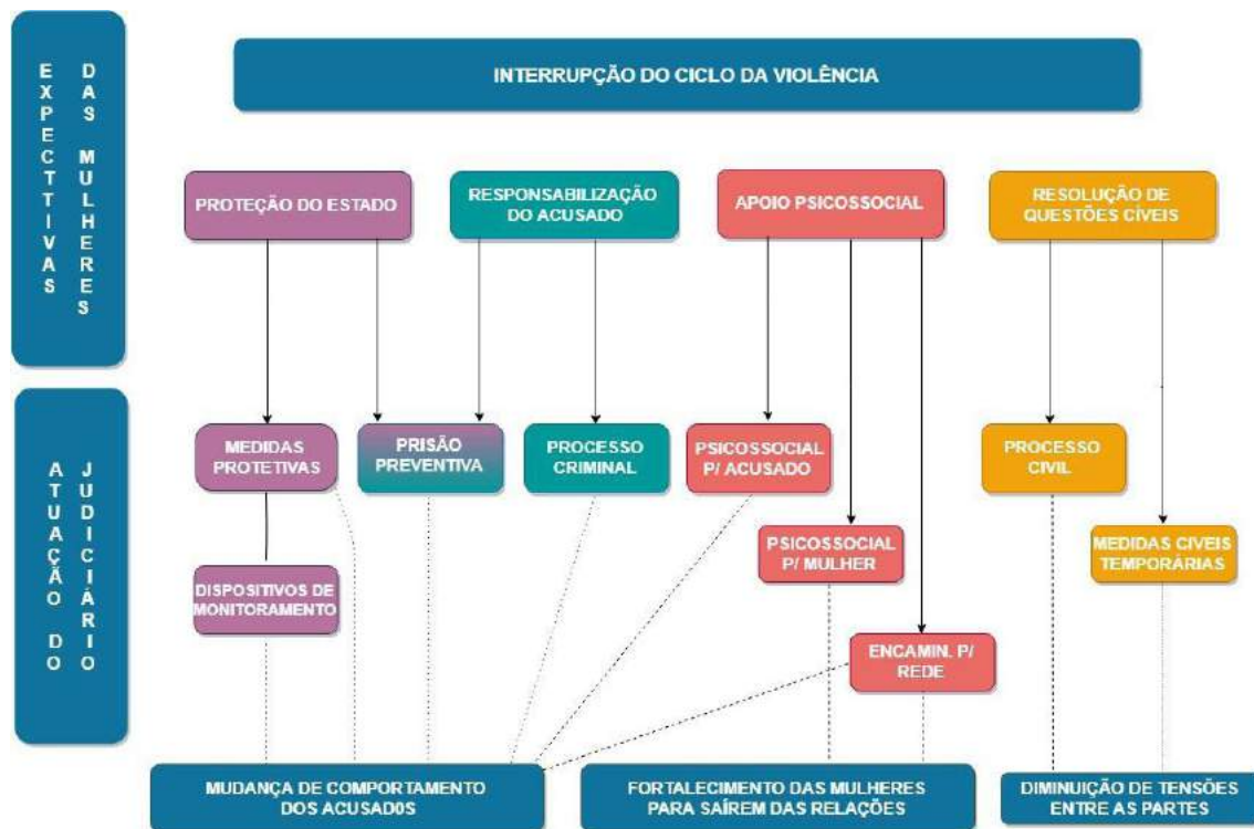
Figura 4. Expectativas das mulheres vítimas de VDFM em relação à Justiça