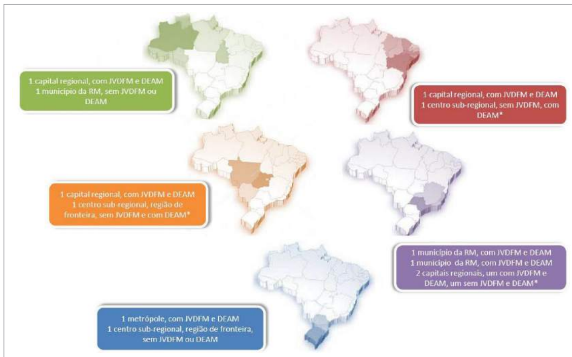
Figura 1. Localidades compreendidas pela pesquisa 13